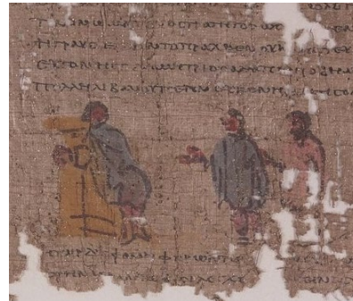
Papyrus d'un roman BNF, cod. suppl. gr.1294

Ce cours est la clé d'accès à un monde passionnant, la littérature et la culture grecques. La première bonne surprise sera la constatation que l'alphabet est facile à apprendre.