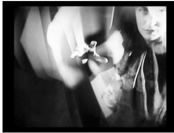
La Chute de la maison Usher (Epstein, 1928)

*Ce cours en ligne, offert en mode asynchrone, est ouvert à l'ensemble des étudiant-es, et plus particulièrement à celles et ceux qui s'intéressent à la réflexion théorique et critique du cinéma.