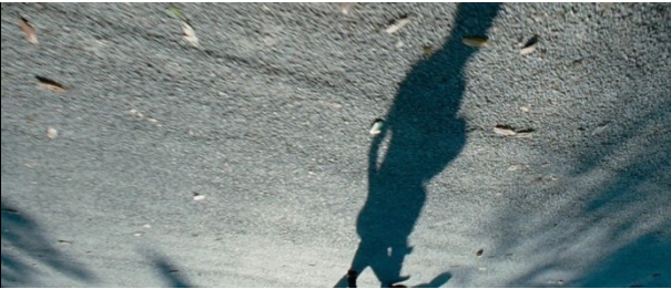
The Three of Life (Terrence Malik, 2011)