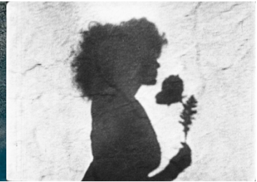
Meshes of the Afternoon (Maya Deren, 1943)