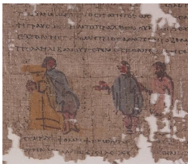
Papyrus d'un roman BNF, cod. suppl. gr.1294

Ce cours est la clé d'accès à un monde passionnant, la littérature et la culture grecques. La première bonne surprise sera la constatation que l'alphabet est facile à apprendre.